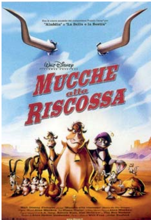
Mucche alla riscossa ( Home on the Range , Disney, 2004)