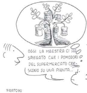
Figura tratta da F. Tonucci (1995), La

solitudine del bambino , La Nuova Italia.