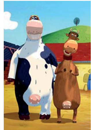
Aia! ( Rai Fiction , Ellepsanime e France 3, 2008)