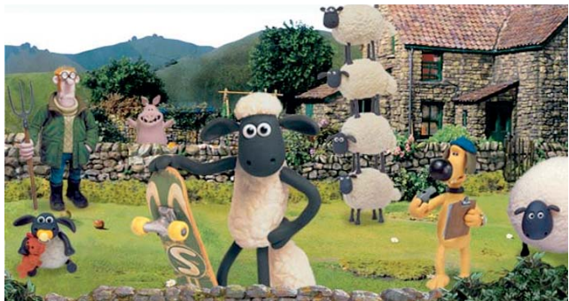
Shaun - Vita da pecora ( Shaun the Sheep , Aardman Animation, 2007)

quanto irreali e distorta. Il progressivo distacco tra città e campagna, tra luogo dove si produce e dove si consuma il cibo, l'affermarsi della dimensione